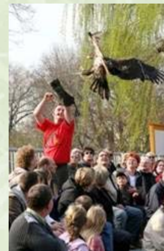
"Tierisch Nah - Arena"